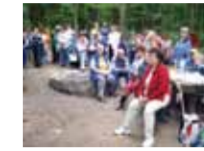
Környezetvédelmi nap - Megújult az öregkői turistapihenő