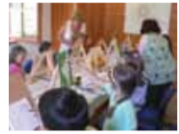
Híres festőktől tanultak

Holcim Hungária Zrt. 1037 Budapest, Szépvölgyi Irodapark, Montevideo utca 2/c III. em.