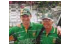
Megmászta a Kilimandzsárót