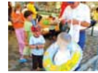
Duna nap Duna nélkül