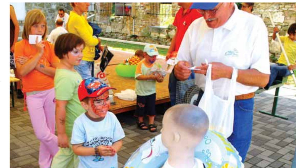
A Gerenday-arborétumban is sokan ünnepelték a Dunát

A felnőttek többsége a rendezvénysátorban talált kikapcsolódást, és menedéket az égi áldás elől. A változatos időt azonban feleltette a jó hangulat és a nagy siker arató ír kocsmazene, majd a nap végén az Elektron Band muzsikájára táncolhattak a Közép-Európa leghosszabb folyóját ünneplők.