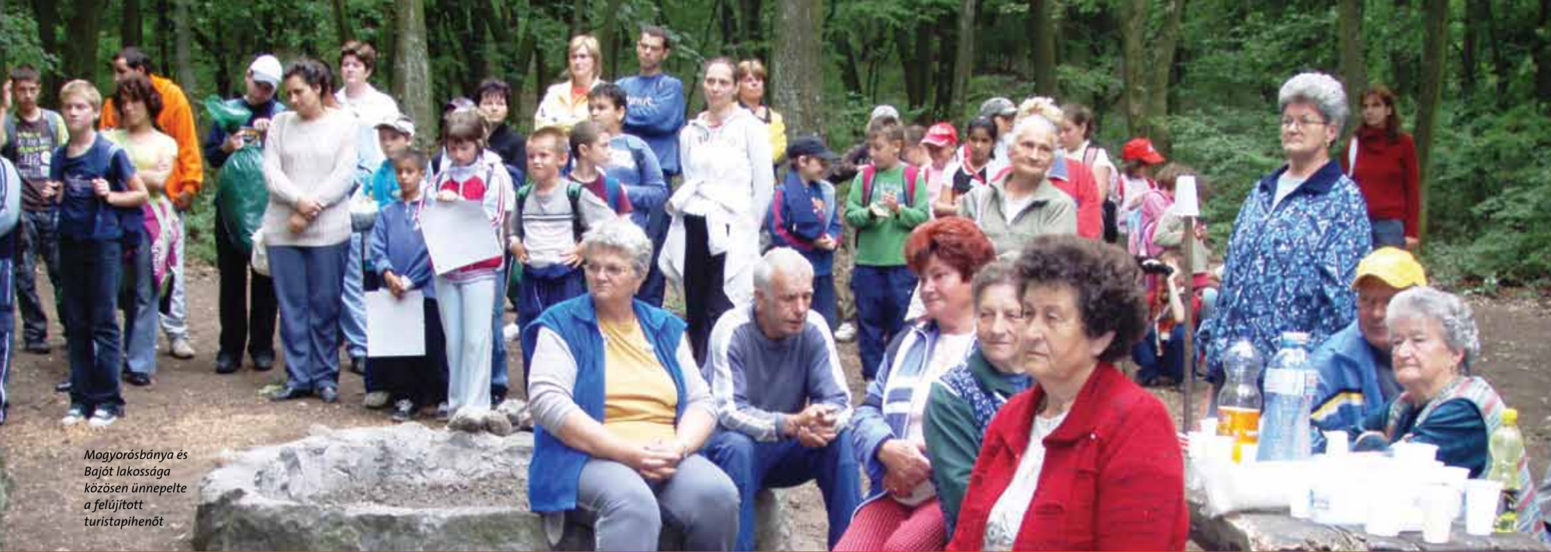
Magyarország és Bajót lakossága közösen ünnepelte a felújított turistapihenőt