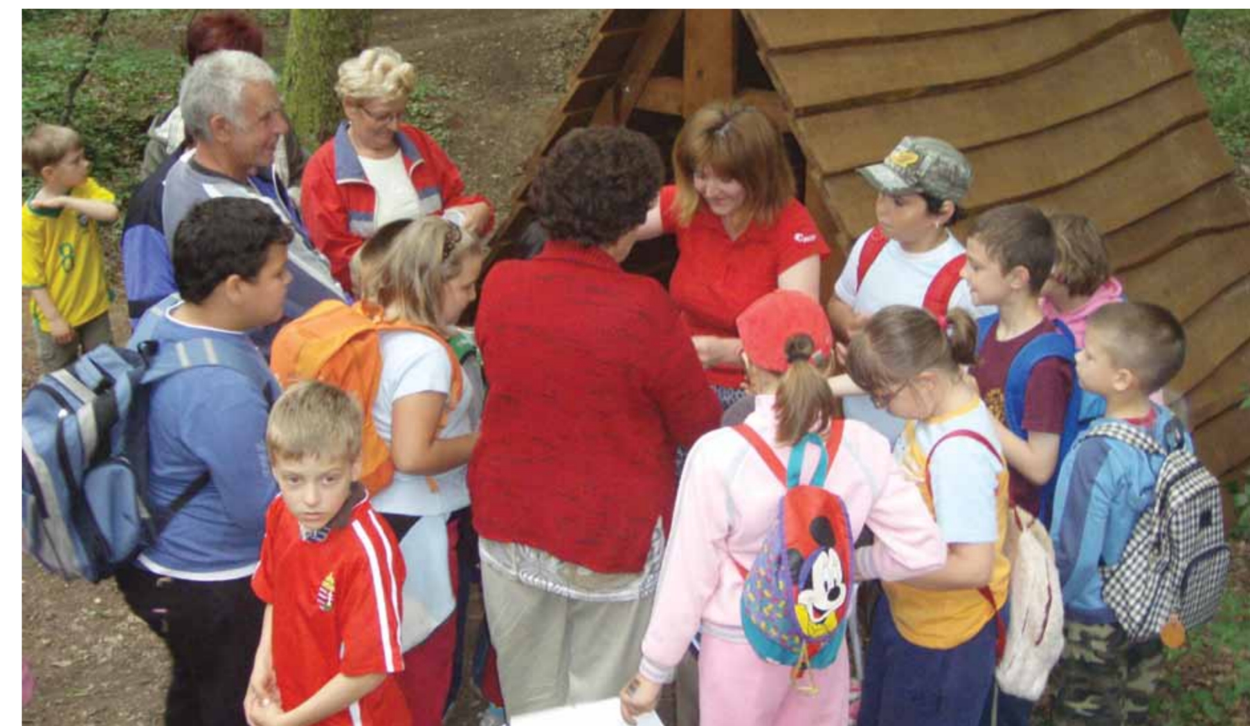
Sokan voltak kíváncsiak a felújított öregkői turistapihenőre