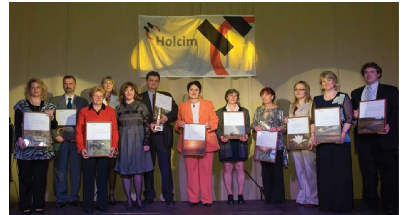
Az idén 11 pályázót jutalmaztak a Holcim-díjon.