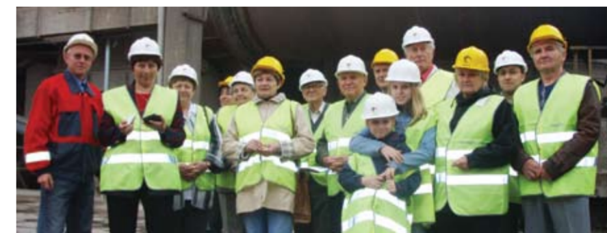
A helytörténészek a cementgyárban: mostantól más szemmel tekintenek a cementgyárra

A 24. alkalommal szervezett vándorgyűlésen a Holcim lábatlani cementgyárát tekintették meg a térség helytörténeti kutatói.